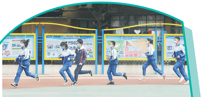
▲体育课，同学们在操场上保持距离分组跑步