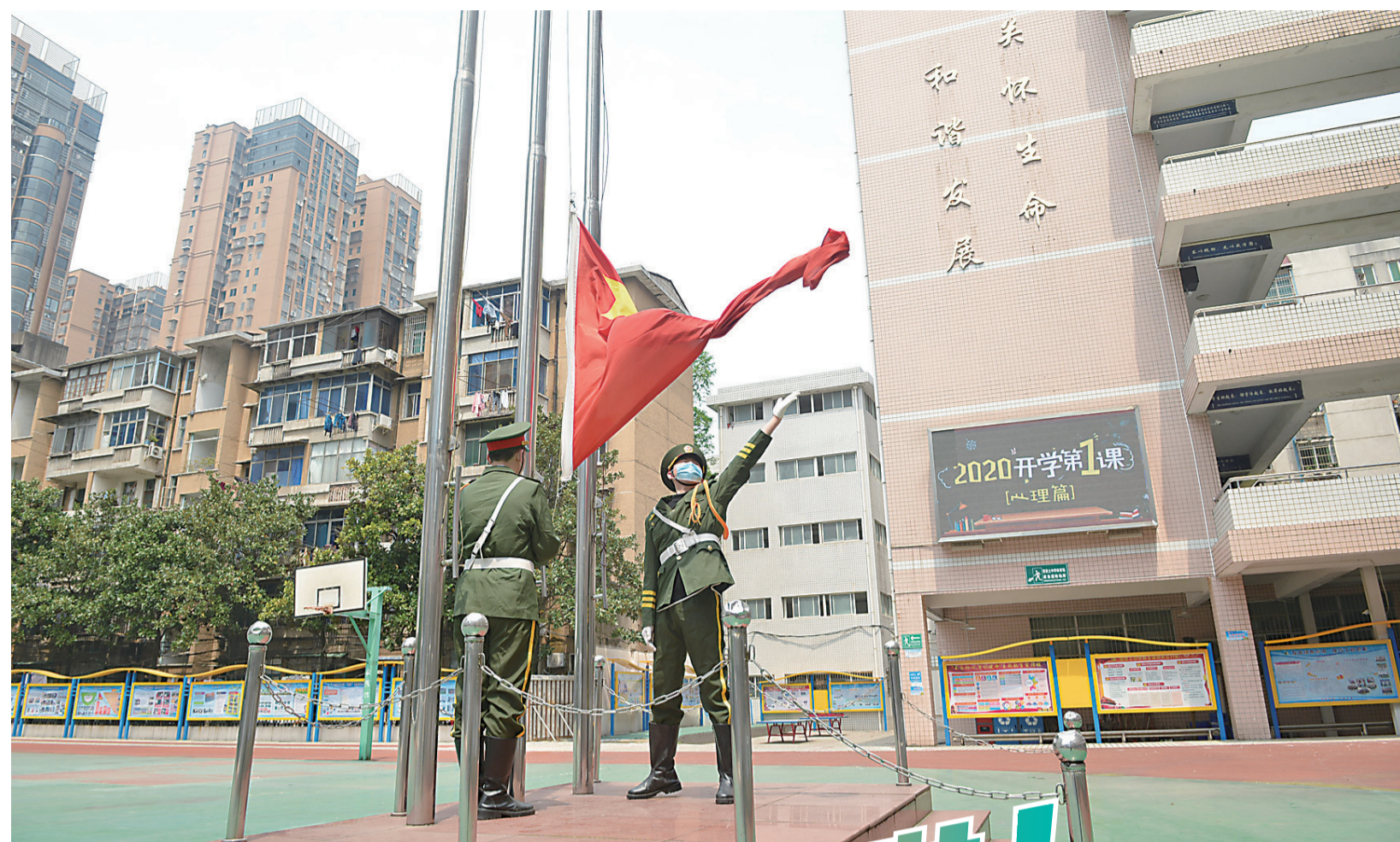
▲昨日上午，贺家土中学，升旗仪式现场只有两名国旗手，学生们在教室起立，唱国歌