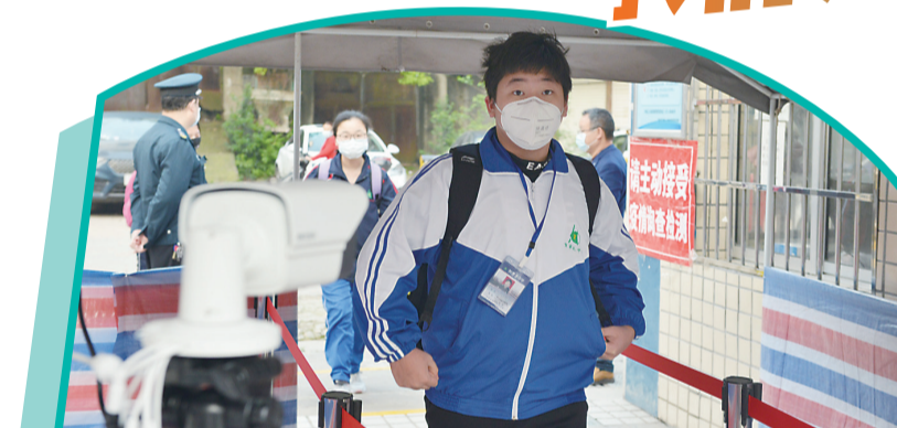
▲学生通过红外体温检测通道进入校园