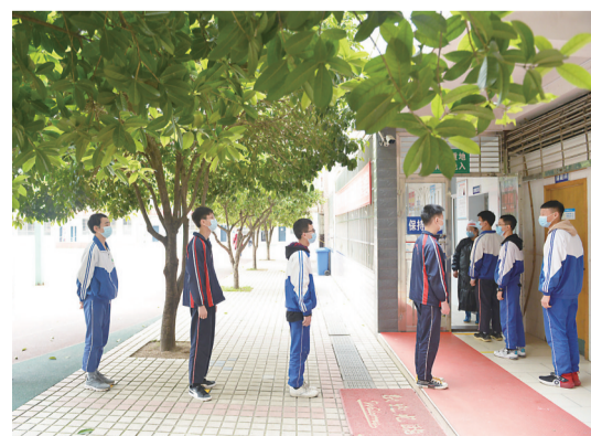
▲中午，学生代表在食堂外排队领餐

昨天，我市初三、高三学生终于结束了“超长版”的寒假，迎来了新学期，安静了两个多月的校园终于热闹起来。 校园里的一切是那么熟悉。“起立”“请坐”“老师好”“同学们好”……这些词瞬间拉近了师生距离。 校园里的一切又是那么新鲜。学生们戴着口罩，接受体温检测后才能进入校园；教室里的垃圾桶、扫帚已被集中放在教室外；饭菜送到了班上…… 花儿盛开，鸟儿欢唱，校园里生机勃勃，一切都在变好。 (记者 何春林/文)