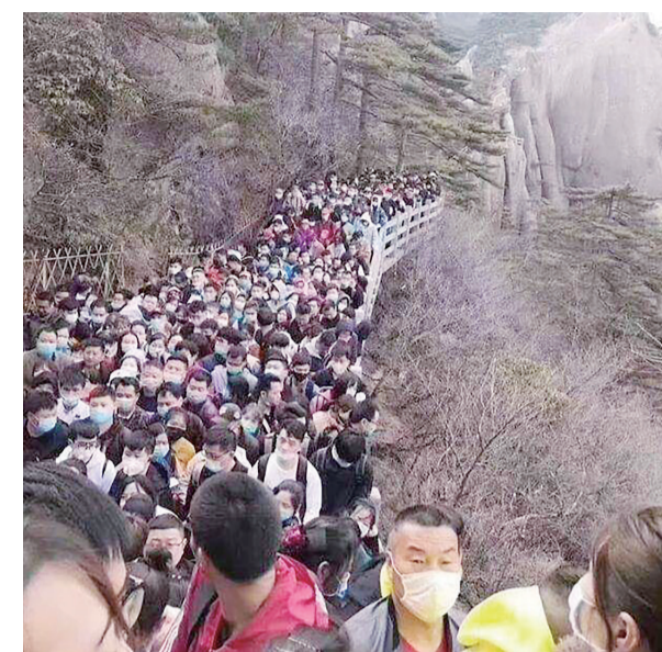
▲清明假期黄山游客显著增多(视频截图)