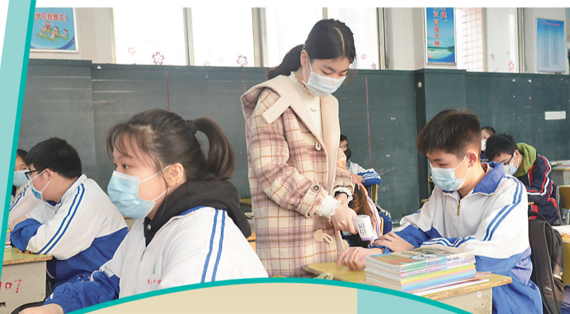
▲班主任老师每天都会对学生进行两次体温测量