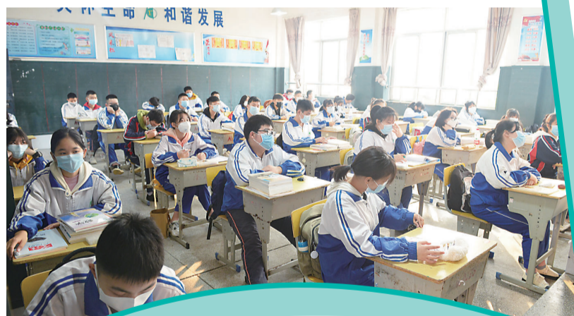
▲开学第一课上的是防控新冠肺炎相关知识

昨天，我市初三、高三学生终于结束了“超长版”的寒假，迎来了新学期，安静了两个多月的校园终于热闹起来。 校园里的一切是那么熟悉。“起立”“请坐”“老师好”“同学们好”……这些词瞬间拉近了师生距离。 校园里的一切又是那么新鲜。学生们戴着口罩，接受体温检测后才能进入校园；教室里的垃圾桶、扫帚已被集中放在教室外；饭菜送到了班上…… 花儿盛开，鸟儿欢唱，校园里生机勃勃，一切都在变好。 (记者 何春林/文)