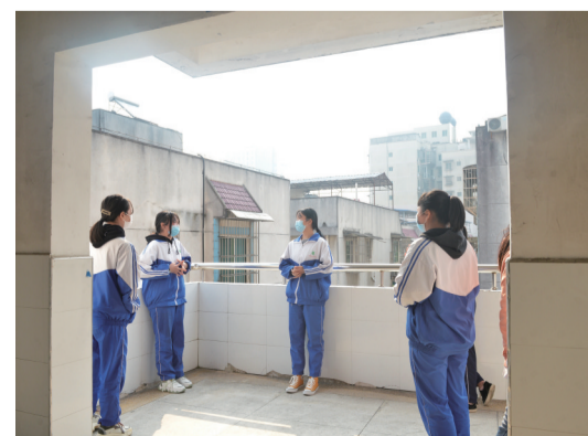
▲课间，同学们保持安全距离交流