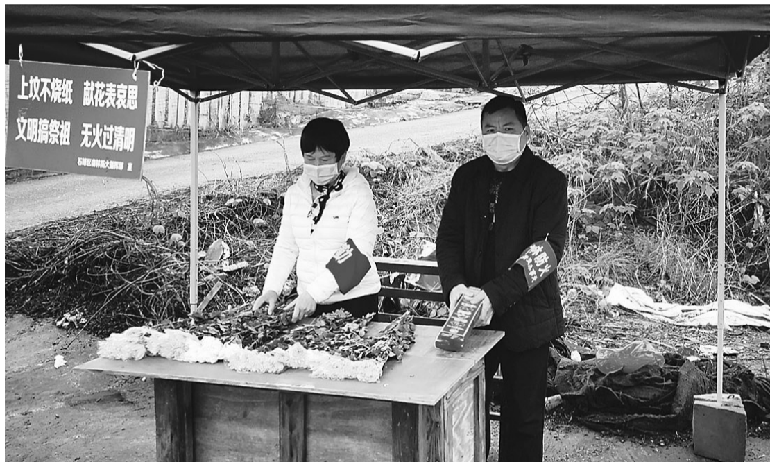
▲4月1日至8日,石峰区78个值守点,均执行菊花换鞭炮政策

本报讯(记者 李卉)今日是清明节。为倡导移风易俗,文明祭扫,石峰区在清明节期间开展“菊花换鞭炮,火源不上山”活动。目前该区已经设立78个值守点,对过往人员及车辆进行检查,并免费提供菊花等文明祭祀物品,确保祭扫人员不携带鞭炮、纸钱等易燃物品上山。