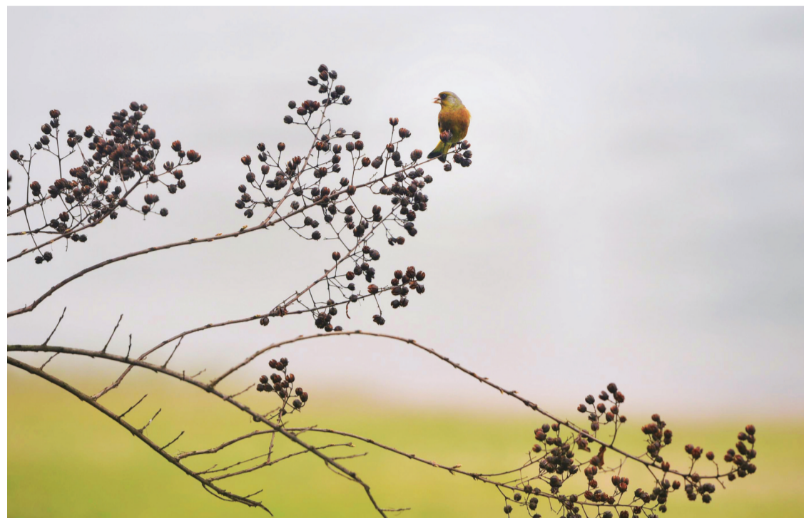
▲近日,河西滨江路,春雨过后,一只黄色的小鸟站在结满果实的枝头叽叽喳喳