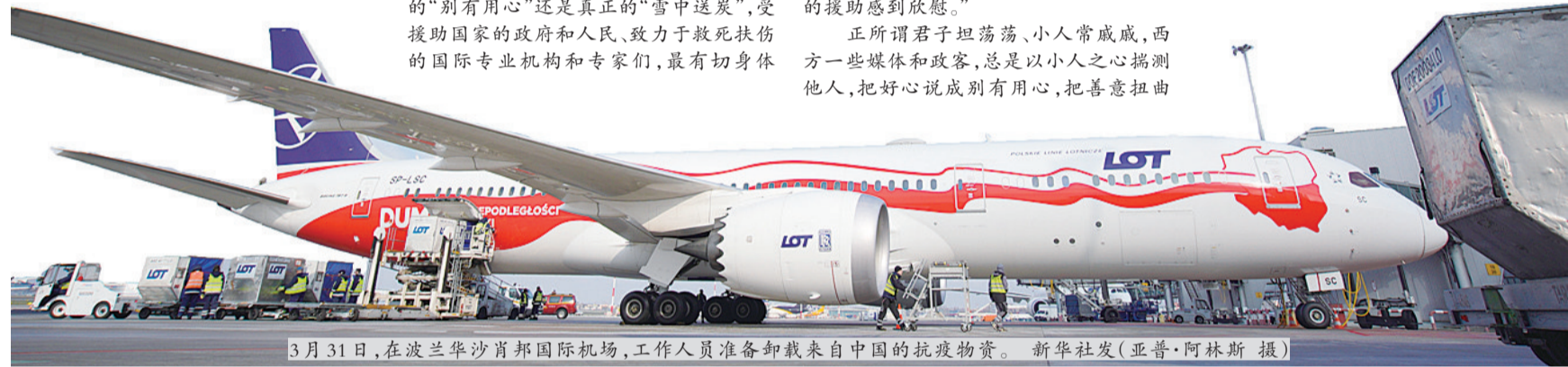
3月31日,在波兰华沙肖邦国际机场,工作人员准备卸载来自中国的抗疫物资。