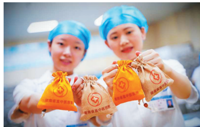
▲源自中医“衣冠疗法”的中药香囊常用于预防瘟疫。

目前疫情缓解,全市各大中小学即将面临复课开学,为科学防控新型冠状病毒感染的肺炎疫情的扩散和蔓延,维护