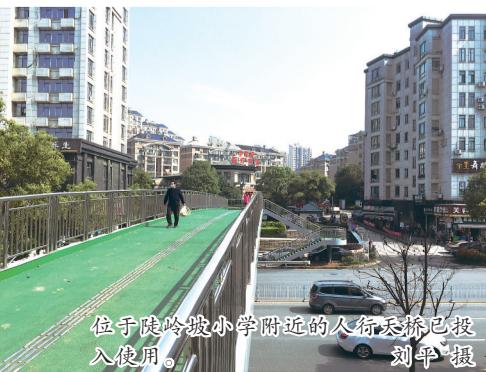
位于睦岭小学附近的人行天桥已投入使用。

荷塘区城乡建设局相关负责人介绍,施工期间,为便于施工,三座人行天桥均以桥附近的小学命名,分别命名为睦岭小学人行天桥、红旗路小学人行天桥和荷塘小学人行天桥。目前,位于荷塘小学前的人行天桥即将竣工,等验收合格后投入使用。3座新人行天桥将全部移交市政部门养护,由民政部门正式命名,待桥的名称正式确定后,桥的名称应该在桥身上体现出来,方便市民识别。