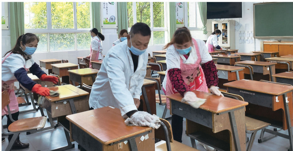
北师大株洲附校对校园内进行全面消毒。孙晓静 通讯员/刘翔 摄

如何正确处理废弃口罩?咳嗽、打喷嚏时该怎么办?在株洲南雅实验中学,全体教职员工的“教师第一课”,是一堂防疫知识问答考试。4月1日上午,该校学校教职员展开防疫演习,扮演老师、