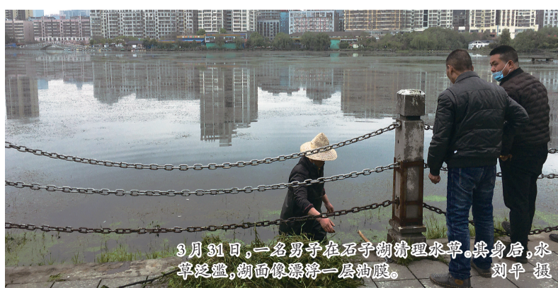
3月31日,一名男子在石子湖打捞水草。其身旁,水草泛滥,湖面像漂浮一层油膜。