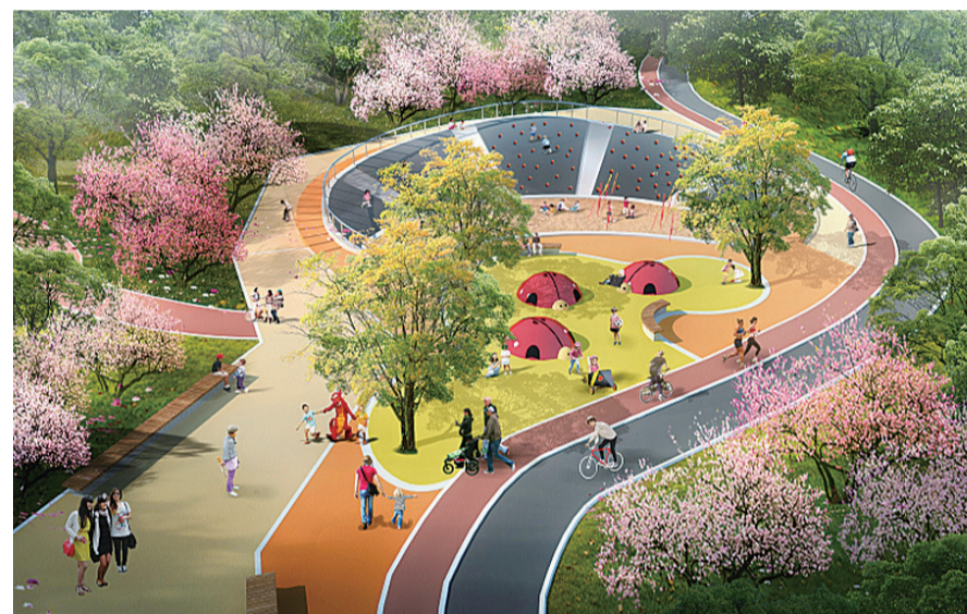
▲金盆岭公园效果图

从 3 月下旬到 6 月底,该区将通过“百日攻坚”行动,力争招商签约 20 个项目以上,开工(竣工)20 个项目以上,重点攻坚 20 个难题,确保实现主要经济指标“时间过半、任务过半”。