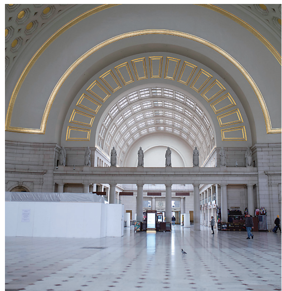
当地时间3月29日在美国首都华盛顿拍摄的旅客稀少的联合车站。

据美国媒体报道,特朗普近来一直受到一些商界领袖的“电话轰炸”,他们警告如果美国经济继续“关闭”,可能会带来灾难性后果,损害特朗普连任的机会。与此同时,也有很多人呼吁特朗普政府“尊重科学、讲究证据”,不要屈从于商界的压力。