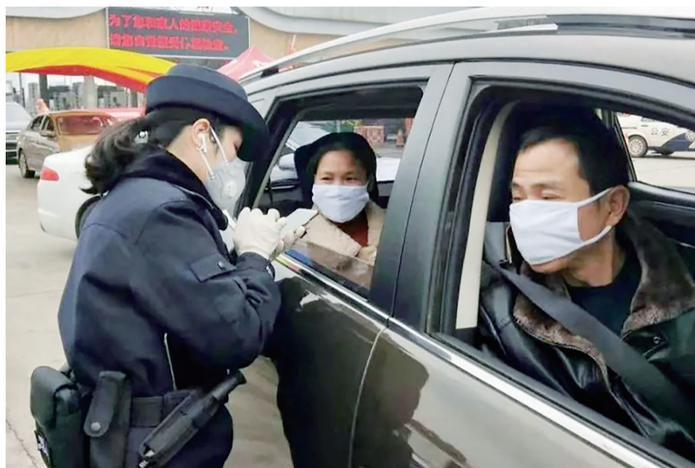
▲株洲西站,民警登记返株人员信息