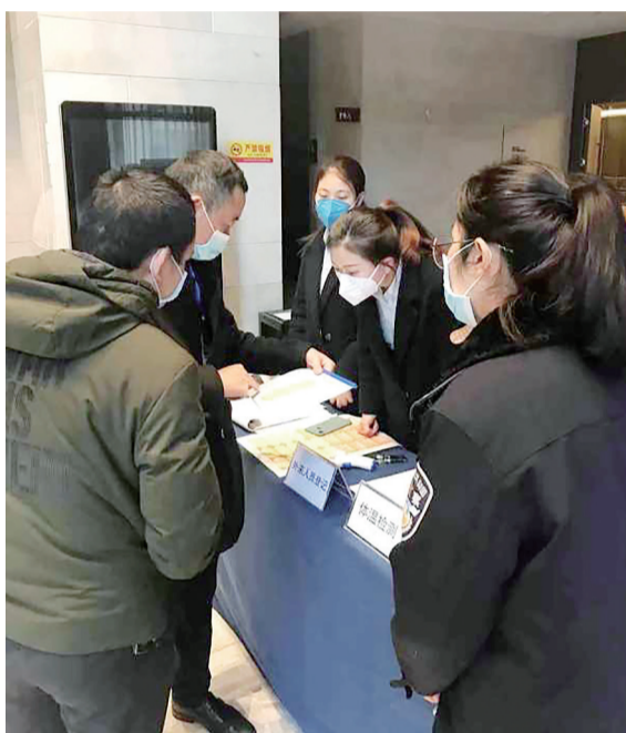
▲民警正核查外来人员信息

1月23日,接到上级部门紧急通知后,天元公安分局成立疫情防控领导小组,由分局全面工作主持人、党委副书记、政委贺晋任组长,抽调民警辅警10人组成疫情防控工作专班,对分局的疫情防控工作进行统筹与调度。全体民警辅警接到通知后,没有一丝怨言,放弃休假,走上防疫一线。