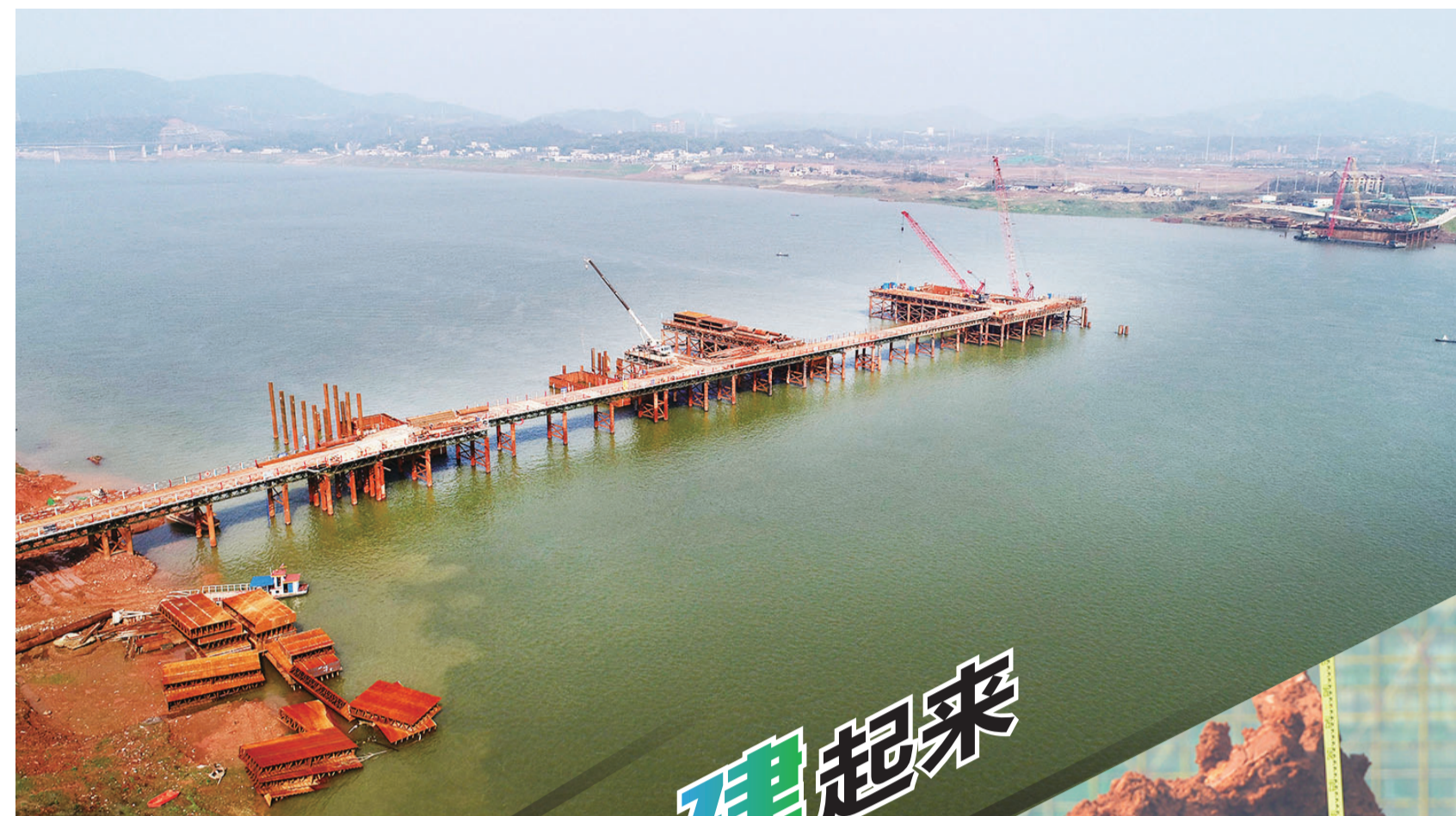
▲建设中的清水塘大桥