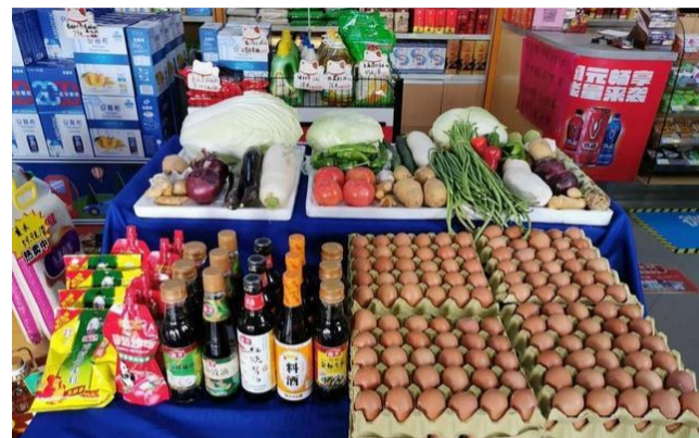
▲南昌卫东加油站销售粮油蔬菜等生活必需品(资料图)

然而,随着疫情形势的变化,复工复产工作的推进,各行各业逐渐恢复正常,跨界企业迈出的步子是否收回来,还是继续往前走?跨界成本几何?效果如何?近日,记者进行了调查采访。