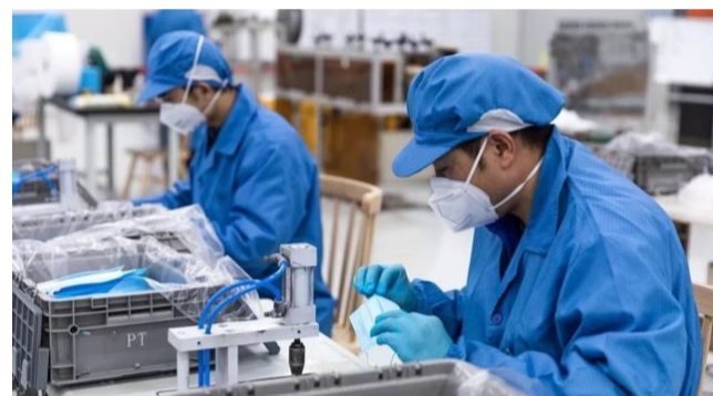
▲上汽通用五菱公司员工加班加点生产口罩(资料图)