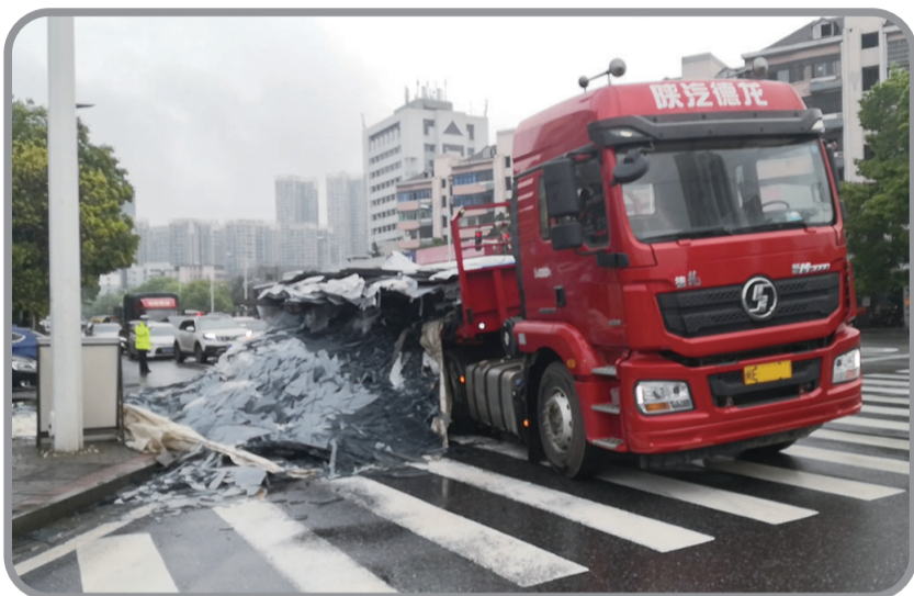
▲货车上的玻璃倾覆将轿车全部掩埋

本报讯(记者 刘翌 通讯员 胡胜兰)昨日上午7时许,石峰区红旗路新白石港路口,一辆装有玻璃的大货车在转弯时,30吨玻璃突然从货厢倾覆,直接将一旁的轿车“吞没”,轿车车顶瞬间被压瘪,车内一家三口被困,其中有一名6个月大的男婴。还好石峰交警及时砸窗救人,车内三人没有大碍。