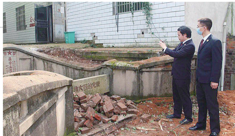
▲检察干警现场监督修缮进度

近日,市生态环境局核实相关举报信息后,对2020年1至3月份第一批符合条件的40名举报人兑现奖励,共发放奖金8000元。