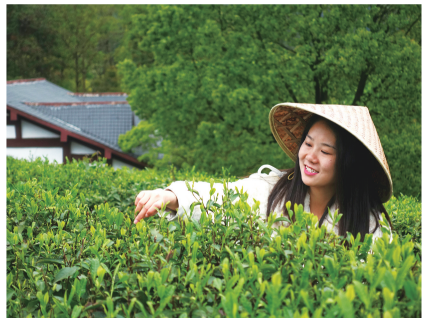
游客们正在酒仙湖景区茶山上体验采茶生活。株洲日报记者 马文章 摄 株洲日报记者 温琳 通讯员/刘凯

株洲日报讯 一场春雨过后,攸县酒仙湖景区轻雾弥漫,湖边一梯梯紧挨着的茶树,又冒出万千新芽,为茶山添上了一抹翠绿。3月28日,攸县酒仙湖景区举办采茶节,300多名游客走进茶山,亲手采摘“明前茶”,体验趣味茶生活。