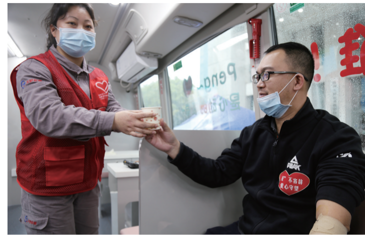
▲志愿服务队提供后勤保障服务

在做好安全生产和自身防疫的同时,用实际行动践行责任担当。3月27日下午,株洲天桥起重机股份有限公司组织员工开展了主题为“疫”不容辞·爱心守望”的无偿献血活动,86名员工当天献血28100毫升。