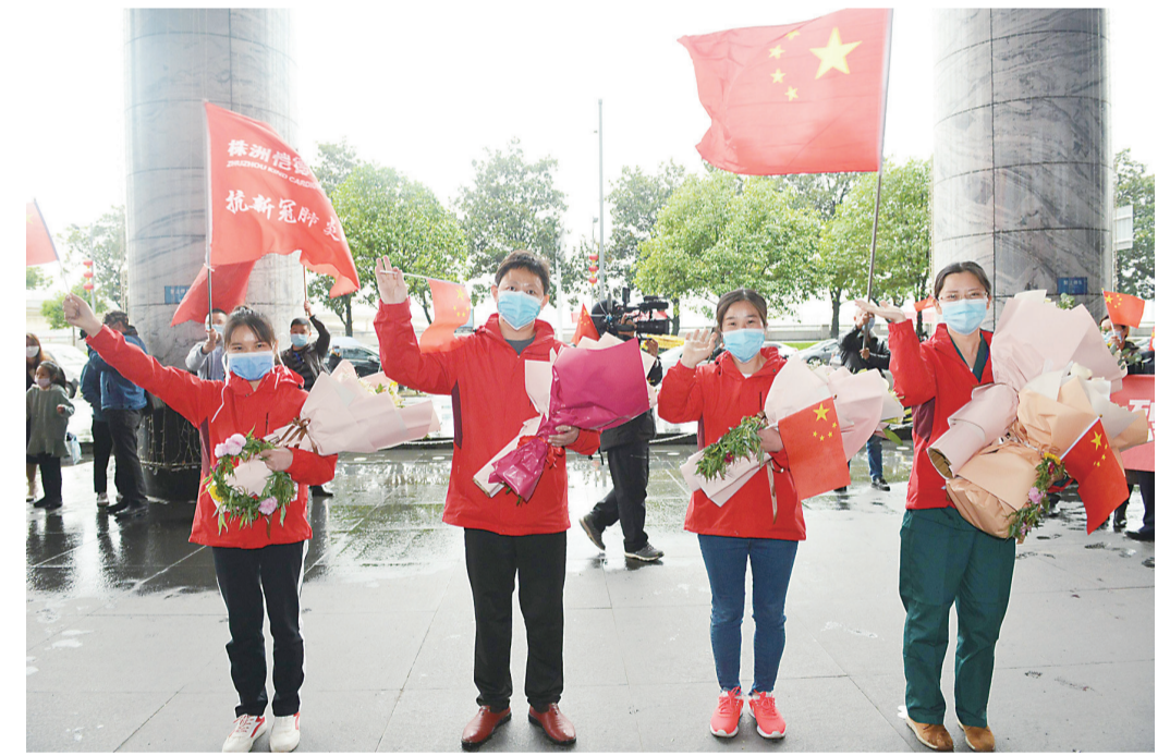
▲四名医疗队员抵达株洲大汉希尔顿酒店