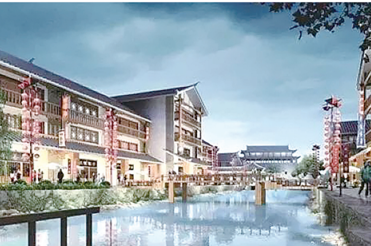
规划中的建宁港复原效果图