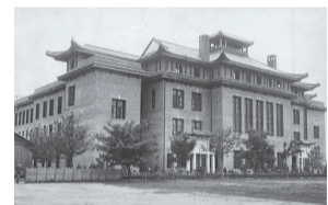
1917年建成的湘雅医院大楼