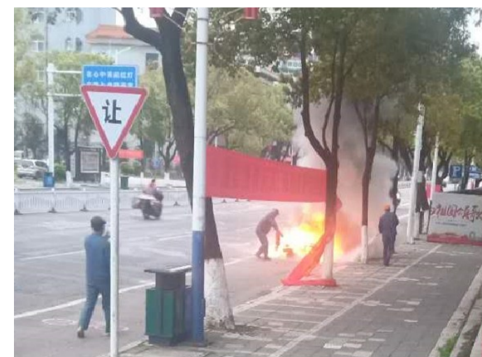
▲环卫工正在灭火 通讯员供图