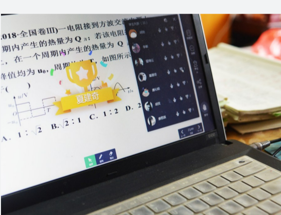
▲老师通过上课软件给回答问题积极的学生点赞