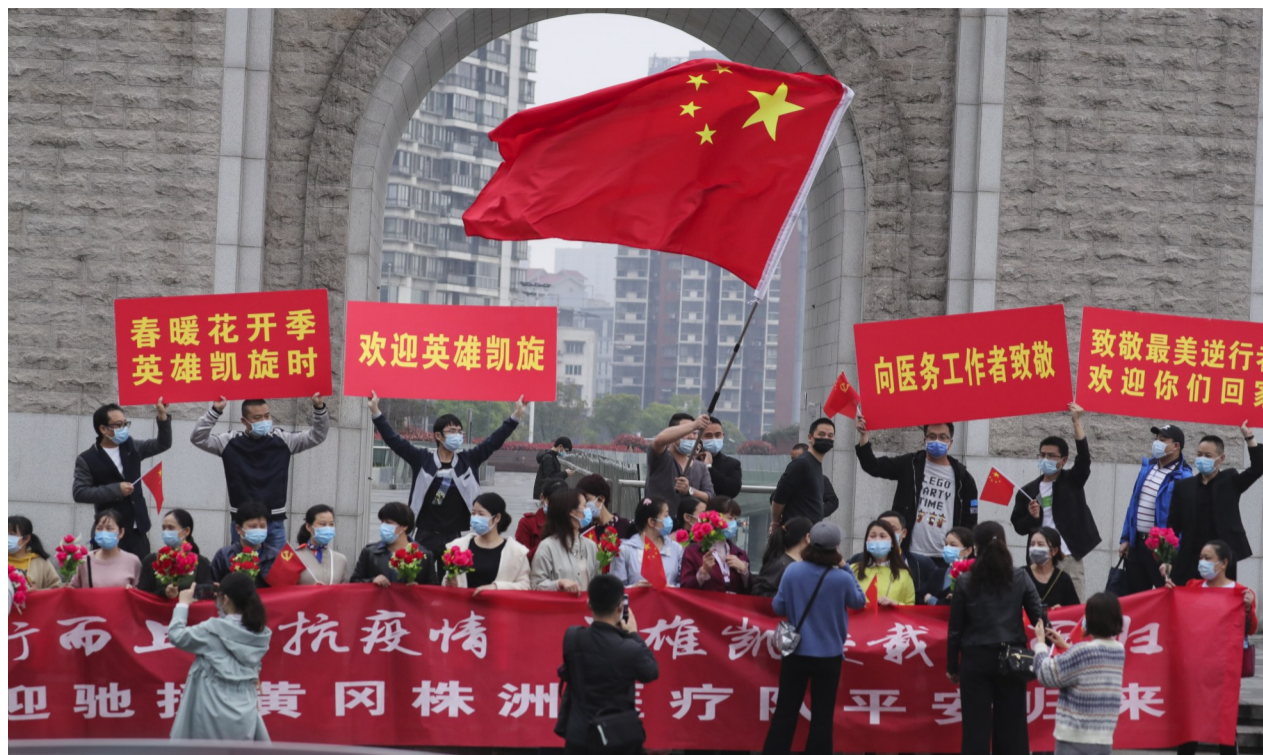
▲株洲大桥上,现场群众热烈的欢呼声和飘扬的五星红旗