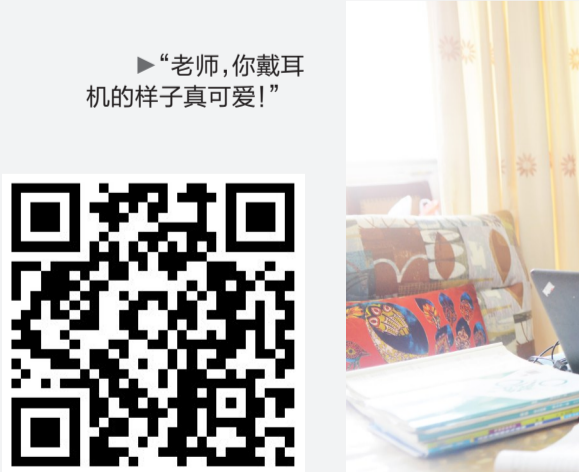
▶“老师,你戴耳机的样子真可爱!”