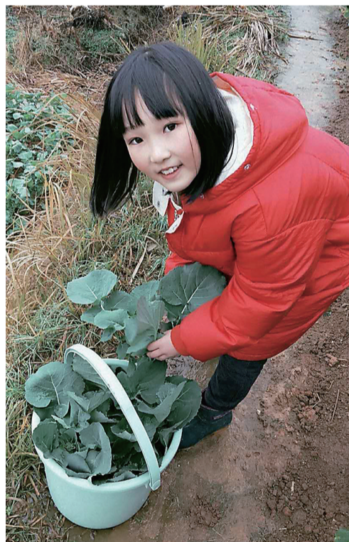
勤春是一块富饶的土地,一分耕耘一分收获。 ——贺家土小学1503班 罗语嘉