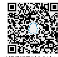
晚报乐活周刊QQ读者群