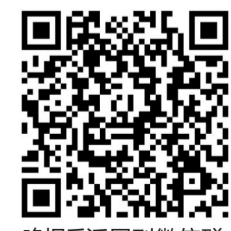
晚报乐活周刊微信群