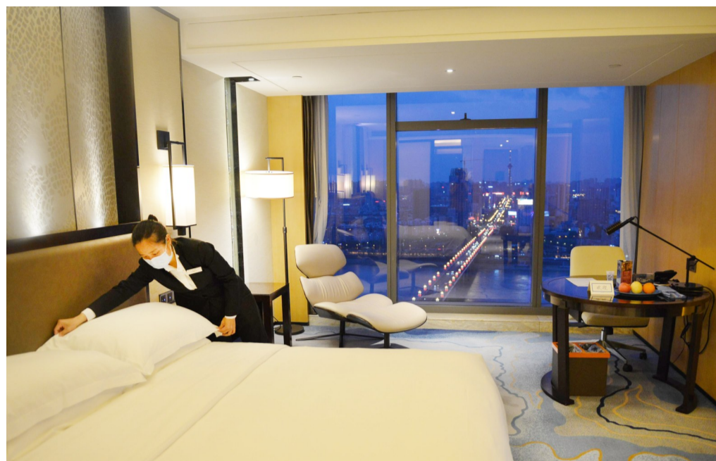
▲3月21日，大汉希尔顿酒店，工作人员正在精心布置房间