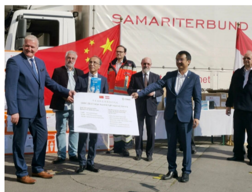
▲中车株机欧洲公司向奥地利捐赠了一批防疫物资

据悉，此次中车株机共向奥地利捐赠3000套防护服、5万只FFP2口罩和10万只一次性医用口罩，防疫物资包装上印有“车联世界，风雨同行”慰问语，寄托着双方同舟共济、共渡难关的决心与信心。