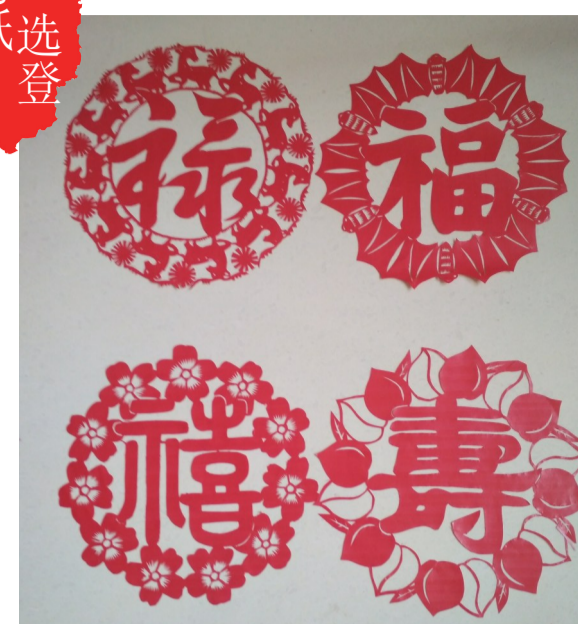
伍芬喜 78岁 天元区湘滨逸墅小区