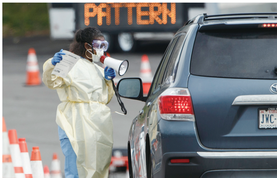
19日,在美国弗吉尼亚州阿灵顿,医护人员在一处“免下车”新冠肺炎检测点引导车辆。

就病毒传播给人类的途径,安德森等作者们提出了两种可能。第一种推测认为,病毒经过在非人类宿主中变异和进化,成为目前致病性较高的病原体状态,然后传播给人类;另一种推测认为,非致病性状态的病毒先从某种动物宿主传播给人类,然后在人类中变异和进化成目前的病原体状态。