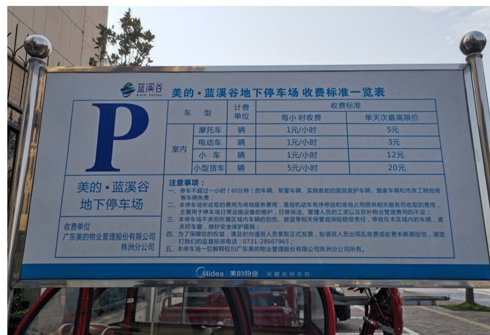
▲小区地下车库入口处有块牌子,上面写着车辆收费管理事项

近日,焦先生拨打晚报新闻热线28829110反映:我骑电动车在别的地方充电,有二维码付款,充一次付一次费,但是在天元区蓝溪谷小区,不管电动车充不充电,都要收费,按照每月40元的标准收取。