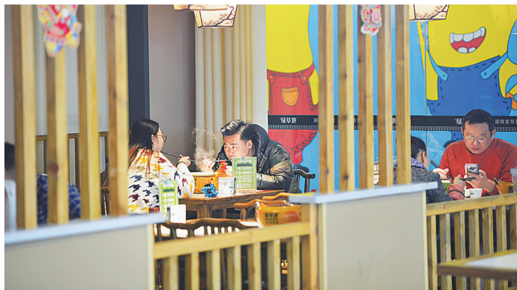
▲餐饮成为很多市民“报复性消费”的第一站

“随着疫情形势的不断好转,体验式、娱乐性消费可能会迎来爆发。”在株洲商业领域工作多年的谭先生认为,目前,众多市民正在重启被疫情耽误的消费计划。“目前餐饮行业的消费已经在迅速增长,接下来会是影院、KTV、酒吧、旅游等业态。”