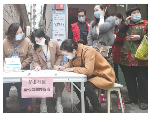
口罩领取点吸引不少居民。