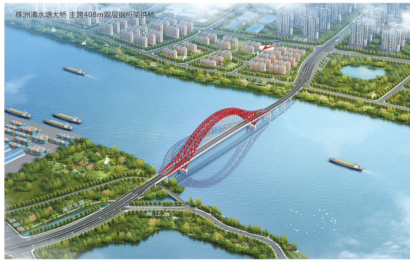
清水塘大桥效果图