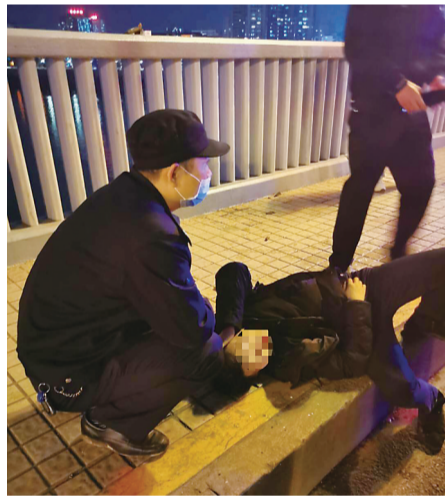
▲民警将男子拉回桥栏杆内