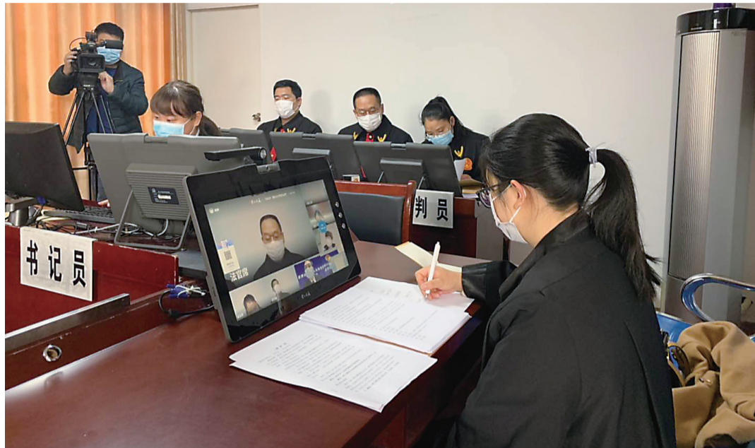
▲渌口区法院通过“云上法庭”,远程开庭庭审

本报讯(记者 贺天鸿 通讯员 谢燕)网络主播沉迷于网络赌博欠下大笔赌债,为筹款“翻本”竟谎称有大量口罩出售。昨日,渌口区法院利用“云上法庭”庭审系统,依法公开开庭审理、宣判被告人彭某犯诈骗罪一案。彭某因诈骗罪一审被判处有期徒刑八年六个月,并处罚金10万元,退赔被害人杨某经济损失43万余元。