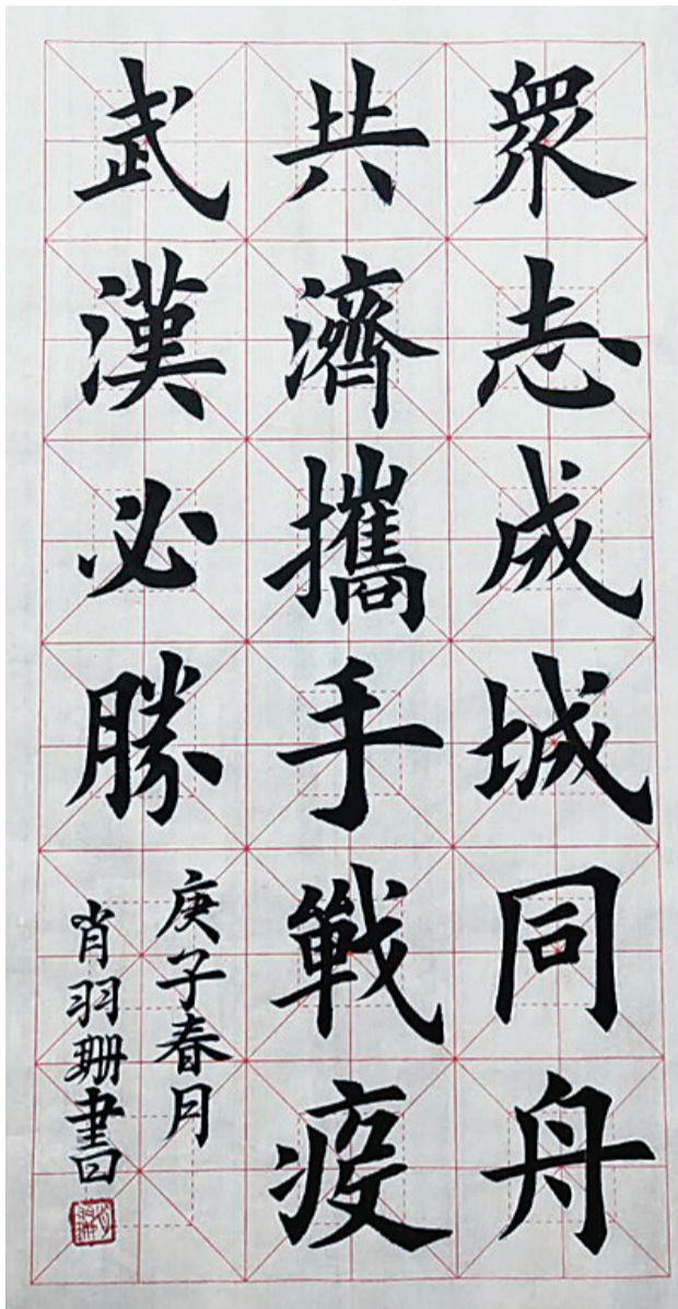
攸县震林中学1912班 肖羽珊 指导老师:胡冰超