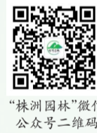
“株洲园林”微信公众号二维码

“互联网+”时代迅速发展,赋予了义务植树新的内涵。近年来,株洲市园林绿化中心加快“互联网+”建设,“互联网+义务植树”、线上植物医生问诊、形色识花等线上功能逐步完善。这一次,株洲市园林绿化中心联合株洲市融媒体中心联合打造“义务植树月”线上系列活动,就是“互联网+园林绿化”模式的实践,不仅传播了植绿护绿理念,更是为创建国家生态园林城市贡献力量。