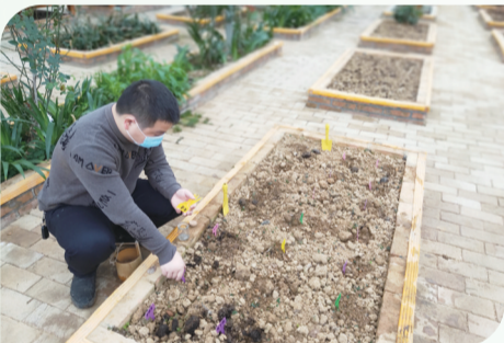
市民为校园记者种下向日葵。