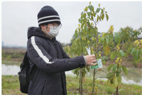
辅导老师为代种的树苗挂上名牌。谢毓铭供图