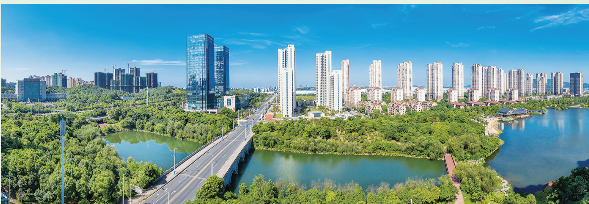
株洲城区一景:让城市长在林中。

面对新冠肺炎疫情的严峻考验,我市创新形式灵活开展各类义务植树活动,把绿色种在春天,也把美丽株洲的愿望和生态文明的理念传递到每一个株洲人心里。