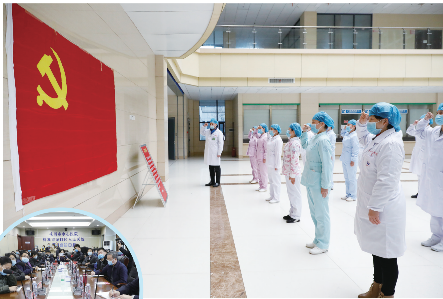
18名医务人员在定点救治医院一线入党。