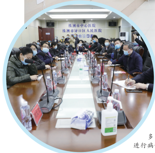
多学科专家进行病例讨论。