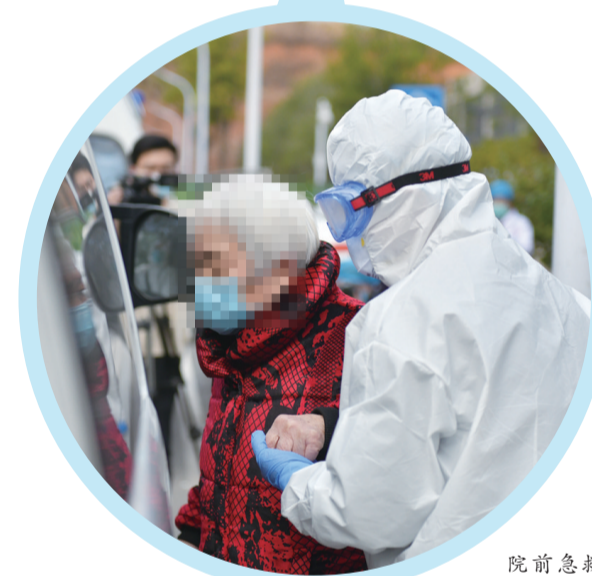
院前急救中心医务人员接送重症出院患者到市中心医院隔离观察。