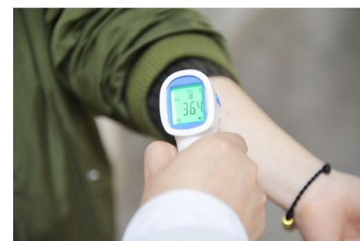
▲同一时间测额头和测手腕上方,体温枪显示的体温不同

本报讯(记者 杨凌凌)在疫情防控期,门岗大叔成了最威风的人,看到你进门就对着你的额头或手腕“来一枪”。体温枪如何正确使用?体温枪对着额头检测,准确吗?昨日,本报采访了市新冠肺炎医疗救治组副组长龙云铸,解读关于体温枪的知识。