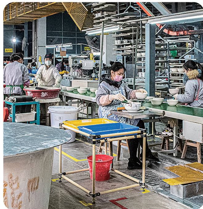
“华联瓷业”生产车间