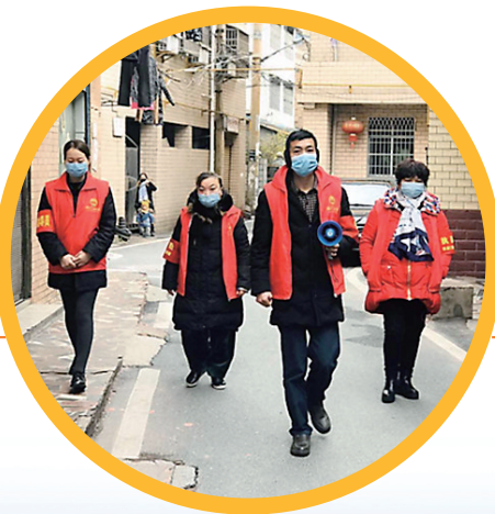
疫情巡逻队员在社区巡防