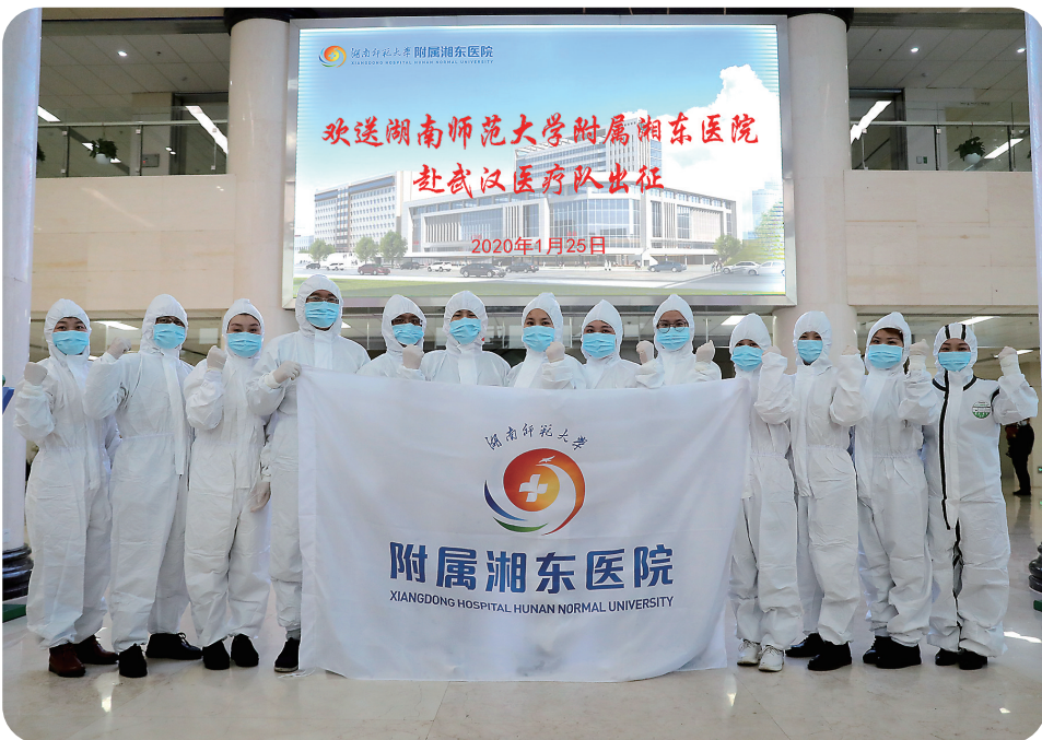
湖南师范大学附属湘东医院13名医护人员集结赴黄冈,参加医疗援助

签订《“十带头”承诺书》,带头亮身份、践承诺,主动投身疫情防控阻击战主战场;5600余名医护人员冲锋一线,坚守急难险重岗位,37名医护人员分别支援湖北黄冈、株洲渌口;1300余名警务人员24小时坚守岗位,6万余名志愿者活跃在各个角落,开展志愿服务活动超过10万场次;800余名网格员蹲守社区、小区防控一线,奋勇争先。他们,用大勇和大爱,用智慧和信心,守护着这一座城,守护着一城百姓。百万瓷城人民,众志成城,勠力同心,凝聚起抗击疫情的磅礴力量,构筑起疫情防控的坚强堤坝。 加大资金保障,打好疫情防控战。该市统筹资金2000余万元,调配12家储备企业、37家配送企业和26台运输车辆保障供应。支持企业复产、生产防疫物资,韶峰服饰日产隔离服2000件,润富祥服饰、鹭亿达、湘龙机械3家公司累计可日产量20万个。 2月24日,醴陵市疫情防控等级调为低风险地区,全面恢复生产生活秩序。3月1日,随着最后一例在院治疗的新冠肺炎确诊病例治愈出院,该市8名确诊病例已全部治愈出院。截至3月11日,该市连续32天没有新增确诊病例,疑似、待排除病例全部清“零”,疫情防控工作取得阶段性成效。