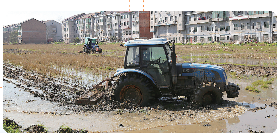
春耕生产火热场景