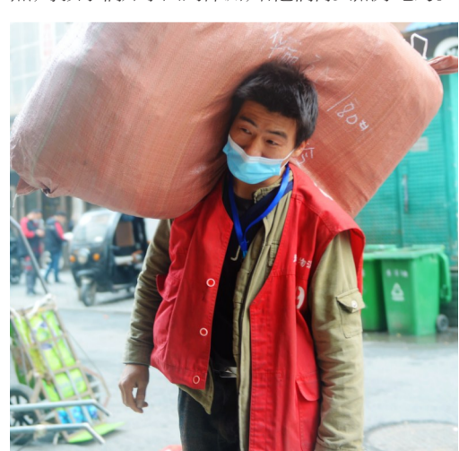
▲刘师傅背起一大袋货品送进市场

“一年之计在于春,多干一点,总归还是有希望的。”刘师傅表示,他所在的市场共有60多名背包工,现在才来20多人。所以他要抓住机会多干一点,等孩子们开学回到株洲,给他们再买点好吃的。