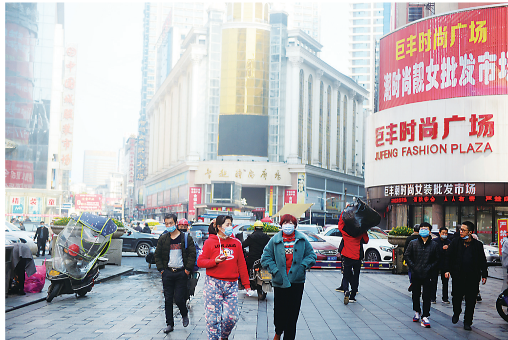
▲芦淞市场群又忙碌起来

记者在多家市场看到,所有进场人员需要出示身份证、个人电子健康码,同时接受体温检测,手部进行酒精消毒。