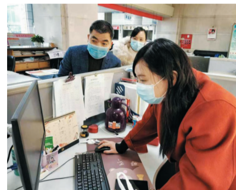
▲春节期间人行株洲市中支国库核算人员加班加点处理防疫拨款业务

截至3月10日，株洲市全辖共办理防疫资金712笔，金额6416.76万元，其中春节期间共办理55笔，金额672.76万元。