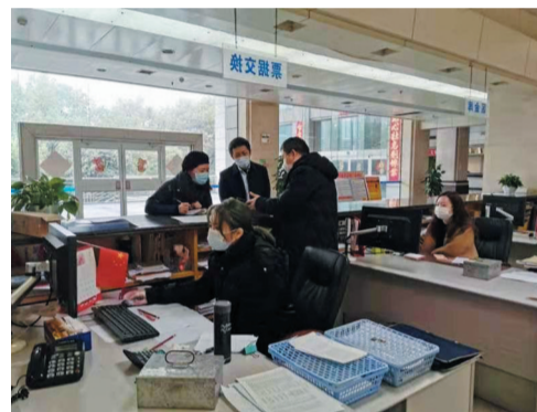
▲人行株洲市中支纪检人员督查疫情核算一线防控工作落实情况