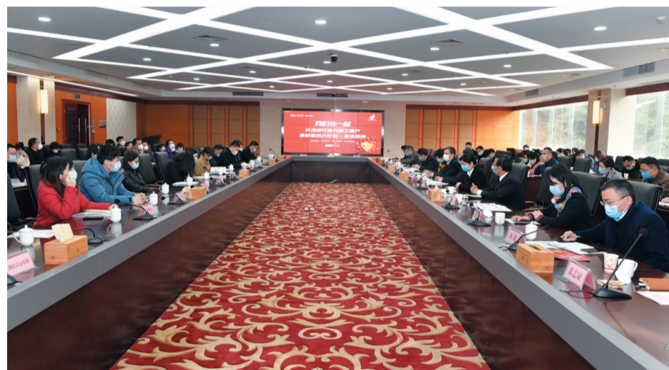
▲助力复工复产金融服务大行动现场

同心战疫，共克时艰！3月11日上午10点，“我们在一起”长沙银行助力复工复产金融服务大行动·走进株洲活动在天元区政府举行。株洲市高新区党工委书记、天元区委书记周建光，株洲市政府副秘书长邓平，株洲市政府金融办主任唐琪，长沙银行副行长张曼，高新区党工委委员、高新区管委会副主任罗克俭等多位领导出席了本次活动，共计60余家企业代表深度参与了本次服务对接会。 3月启动的长沙银行助力复工复产金融服务大行动，将持续走进全省13个市州。