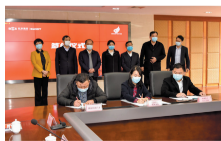
▲会上，长沙银行株洲分行与企业进行融资签约

“能否将流动资金的用途放宽一点，并制定方案，能够贷到长期贷款”。对接会上，湖南立方新能源科技有限责任公司代表表示，公司已经成功获得长沙银行授信，但也希望得到政府和银行更多的支持。