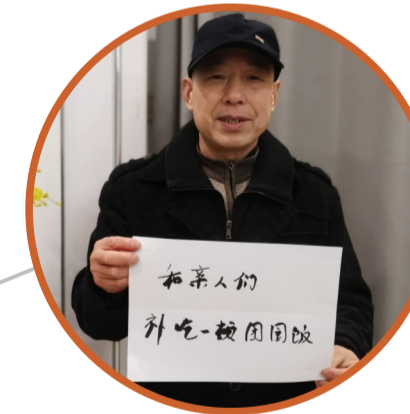
▲记者 肖蓉 摄