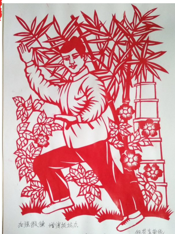
伍芬喜 78岁 天元区湘滨逸墅