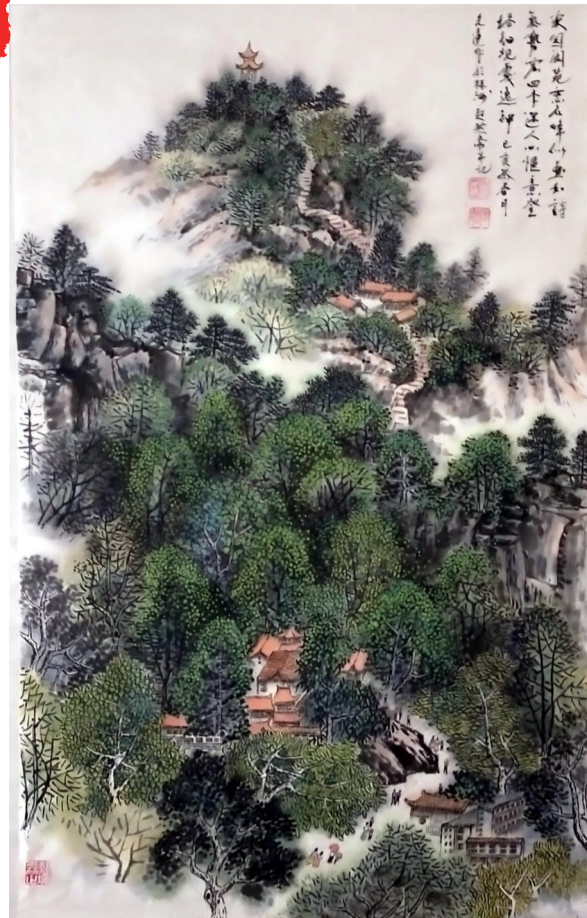
汤光远 67岁 天元区钻石怡园