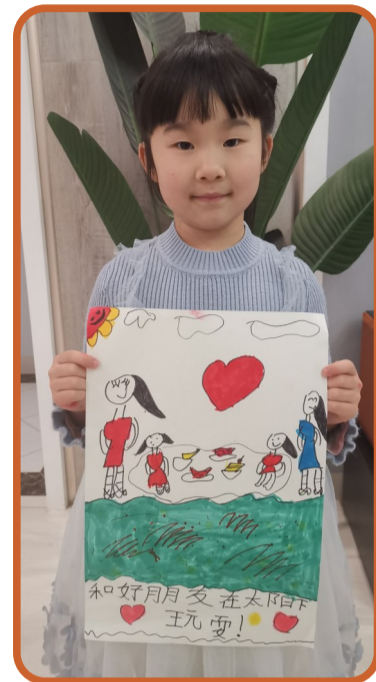
▲记者 肖蓉 摄

我从来没有去过武汉,只听同学说过武汉大学的樱花有多美,热干面有多韵味。这次疫情过后,我要去武汉看看,找他叙旧聊天,一起回忆校园时光,一起去看看大樱花、逛逛黄鹤楼,一起去吃碗热干面、豆皮。