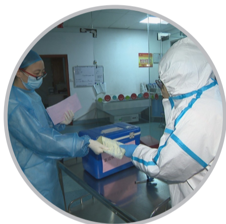
▲ 株洲调拨200毫升AB型新冠肺炎康复者恢复期血浆支援长沙(资料图)

这是我市首次采集新冠肺炎康复者血浆,将用于新冠肺炎重症、危重症患者治疗。3月7日7时,市中心血站紧急调拨200毫升AB型新冠肺炎康复者恢复期血浆,支援长沙市新冠肺炎危重症患者抢救工作,共同抗击疫情。据悉,自2月18日开始,市中心血站启动采集新冠肺炎康复者恢复期血浆工作,随后的18天内,全市共有8位新冠肺炎康复者捐献恢复期血浆3200毫升,捐浆人数和量均排名全省第一。