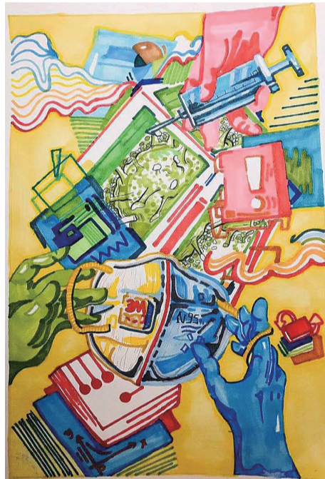
1405班 徐熙梓 指导老师:刘意