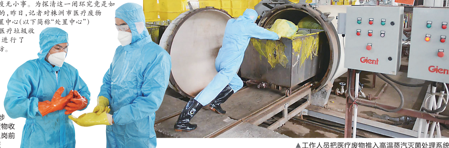
▲工作人员把医疗废物推入高温蒸汽灭菌处理系统