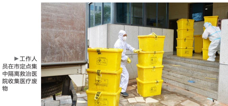
工作人员在市定点集中隔离救治医院收集医疗废物