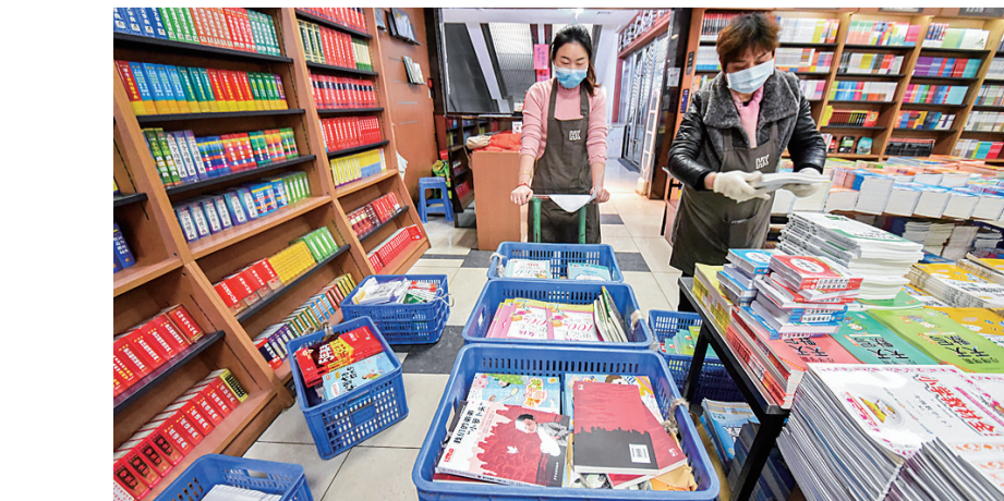
市新华书店的工作人员为网购的市民准备教辅书籍。