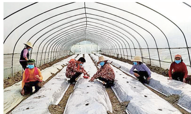
茶陵县湖口镇新苑村,村民们正在培育西瓜苗。

今年的春耕少了开耕的热闹,少了田间“串门”的乐呵,少了地头“解乏”的诙谐,但田野里抢抓时节忙生产的紧迫感没有减,农资运输、技术相授的服务力没有减。这也将助力我市的农业生产图丰沛多彩、粮饷优质。特殊时期,这个不“闹”的春耕里,憋着一股越挫越勇的劲,这劲头,为赢取今年的农业丰收攒足了希望。