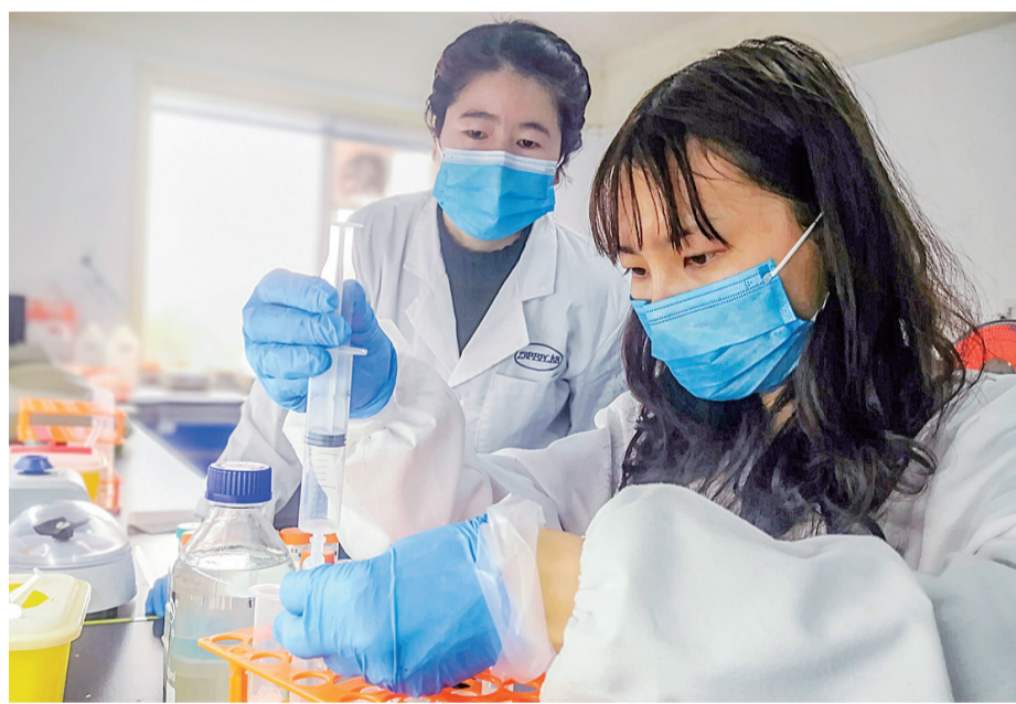
湖南中晟全肽生化有限公司,实验室里紧张有序。