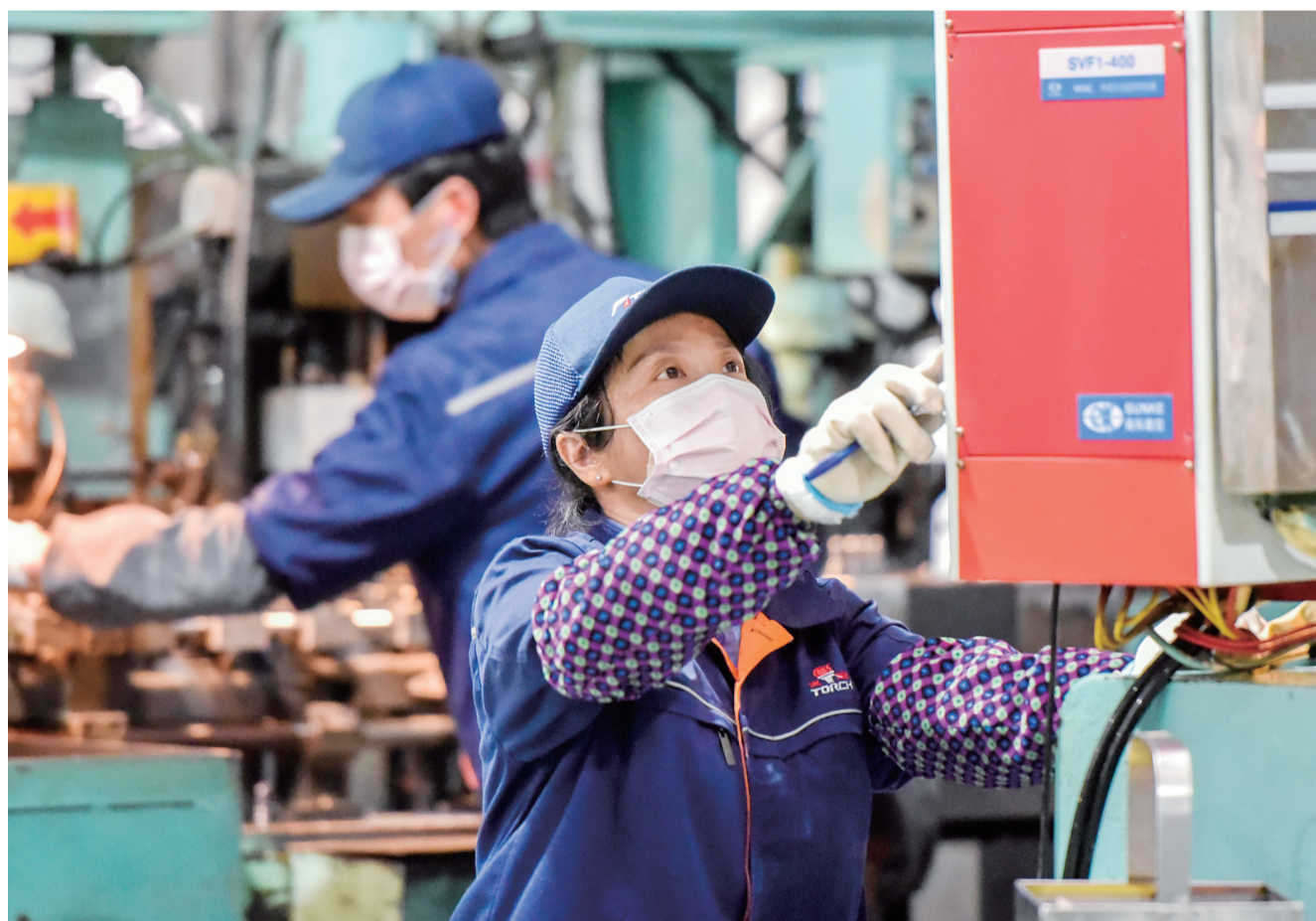
株洲火炬火花塞有限公司生产线上,质检员一丝不苟。