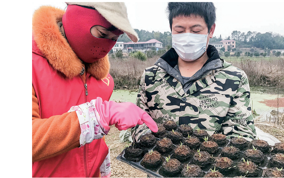
天元区石塘山养殖合作社,在合作社女员工们的精心培育下,辣椒苗长势良好。