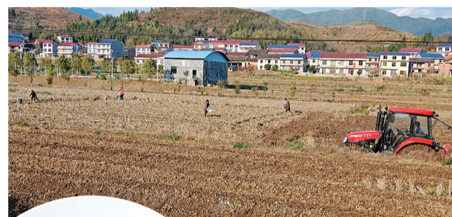
茶陵县腰路镇路理村,天气晴好,机器轰鸣,村民们正在芋田里起垄施肥。