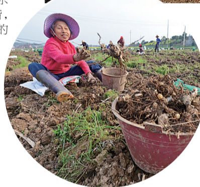
茶陵县马江镇红旗村,1600亩生姜种植基地开始了收获的季节。