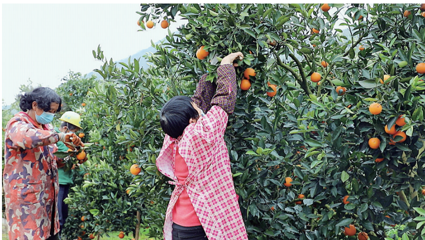
茶陵县枣市镇洞头村,冰糖橙果园内,果农正在采摘树上的果实。