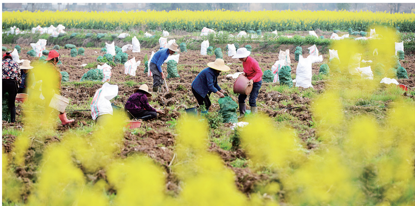
春回大地,生机勃勃,在广袤肥沃的土地上,劳作春耕忙碌的身影越来越多!