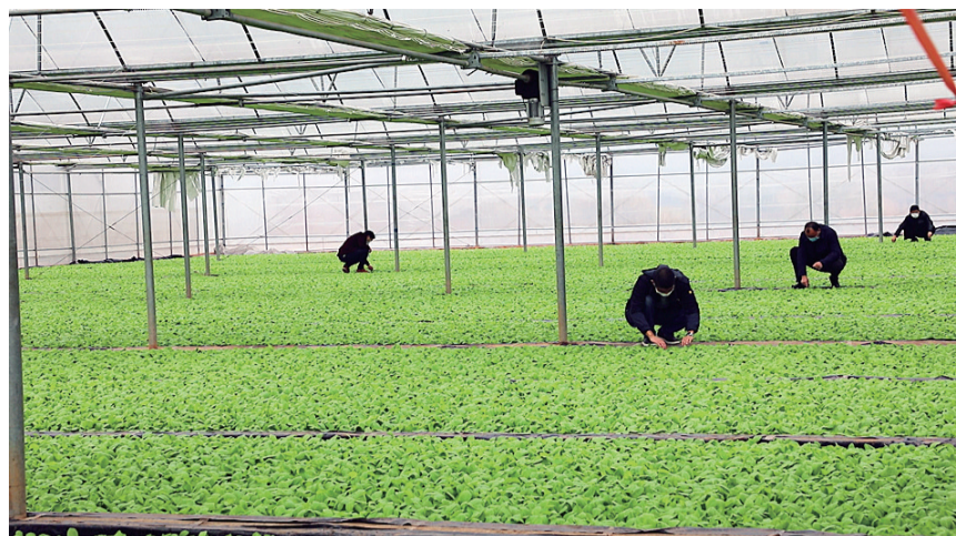
茶陵县枣市镇洞头村,育苗大棚里绿意盎然,一盘盘水培烟苗排列整齐,长势喜人。