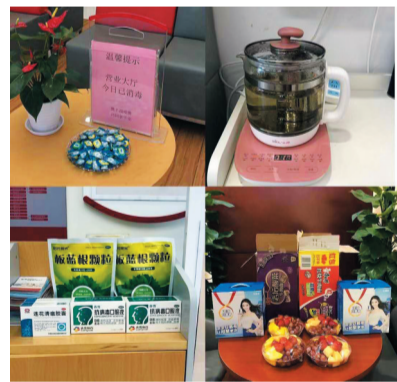
▲已消毒的营业厅还为市民准备了各类感冒预防药品

株洲市中心医院是株洲市疫情防控定点医院,受疫情影响现金出现积压,建行株洲城南支行获悉后,立即启动现金服务绿色通道,协调押运车辆和人员,上门收款360余万元。截止到2月13日,株洲辖区各金融机构累计为疫情防控相关单位办理应急取现253笔,金额1570万元,主动上门为医院、农贸超市、公交、加油站等办理现金回笼986笔,金额3750万元,为抗击疫情提供强有力现金服务保障。