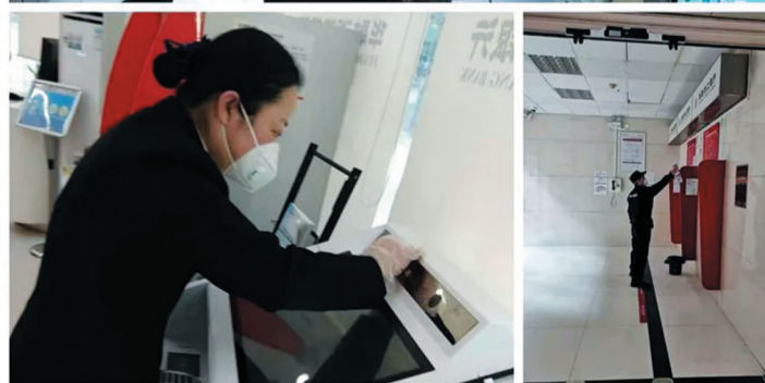
▲工作人员进行无死角消毒