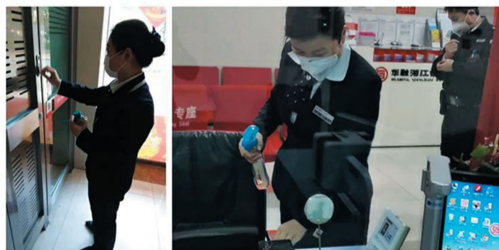
▲工作人员进行无死角消毒

春节过后,随着复工复产的逐步推进,也是现金回笼、流通最为频繁的时期。人民银行株洲市中支督导辖内金融机构严把消毒关,筑牢现金服务“安全网”,确保老百姓用上“放心钱”“卫生钱”;业务操作人员提前到岗,在关键岗位值守,确保现金服务不断档。