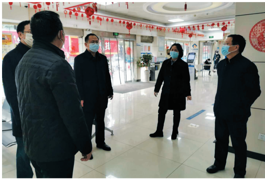
▲人行株洲市中支领导亲临一线,对一线防疫工作做出部署。