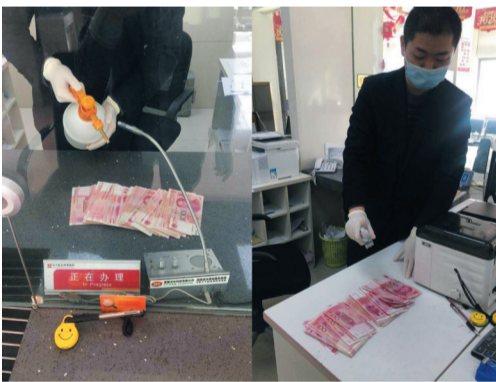
▲工作人员对现金进行消毒