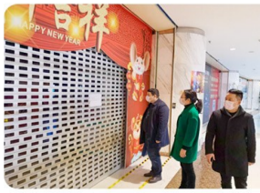
芦淞市场群延期开市。

全市歌舞娱乐、网吧等人员聚集场所 全面暂停对外营业 ，神农城、湘江风光带等开放式景区的室内参观场地 全部关闭 ，所有景区 取消春节活动 。