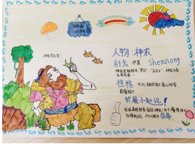
(本版佳作指导老师 彭晓芳)