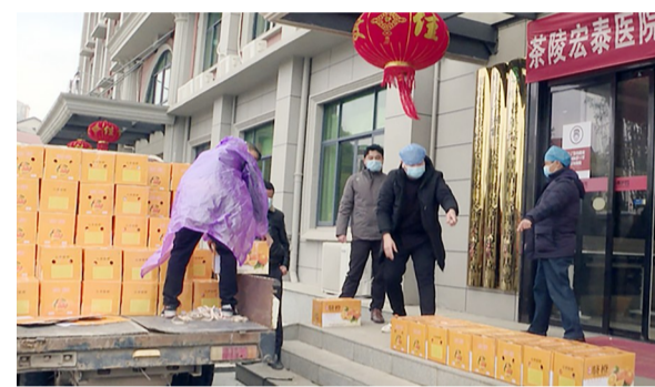
▲316箱脐橙送到战疫一线

本报讯(记者 肖捷 通讯员 尹佳容)在这场没有硝烟的战争面前,不少爱心组织纷纷献出爱心。2月16日,茶陵县高陇镇科协石冲脐橙合作社将316箱价值3.8万元的脐橙捐赠给县人民医院、中医院、妇幼保健院、宏泰医院、县电视台,为奋战在一线的医护人员、新闻记者送去物资支持。活动现场,受赠医院相关负责人代表医院接受了捐赠,向高陇镇科协石冲脐橙合作社致以谢意,并表示,这批脐橙将先后分发到疫情防控一线的医护人员手中。