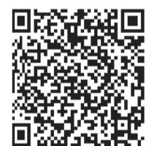
扫码看专访视频 视频制作：吴琦

株洲仍有患者住院治疗，有密切接触者在接受医学观察。新冠肺炎潜伏期平均为14天，其发病机制、流行特点尚未完全明确。所以在这种情况下，我们不能掉以轻心，还需要加强我们的防控工作，进一步扩大监测筛查范围，及早发现病例，阻止疫情进一步传播。