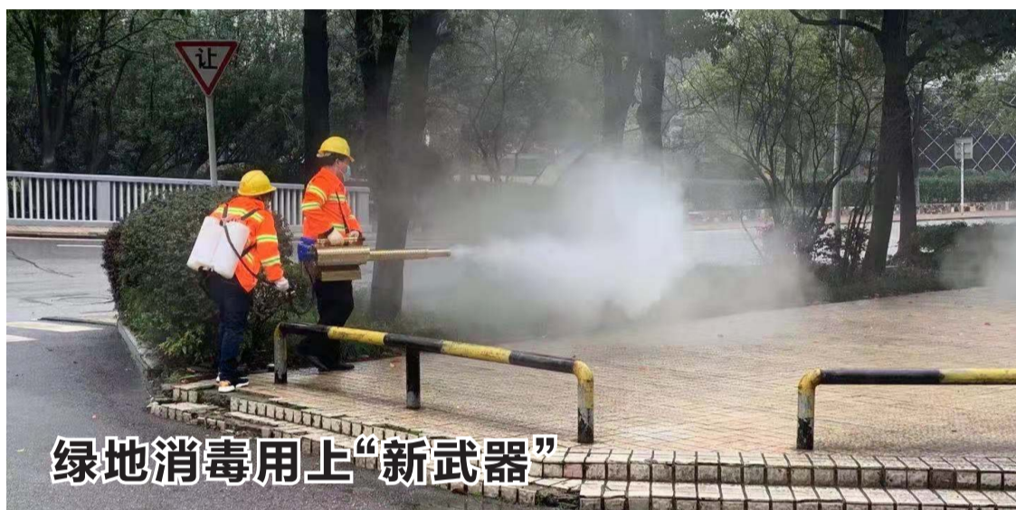
绿地消毒用上“新武器”

炎陵县百惠大药房、炎陵县人民药店、炎陵县天康大药房十都园康店、炎陵县天天康大药房仁康店、炎陵县天天康大药房策源店、炎陵县何生特价批发超市未按规定明码标价销售口罩,该局拟对这些店分别处以1000元至3000元不等的行政处罚;炎陵县康复医疗器械有限公司不如实提供所需资料,该局拟对其处以20000元罚款的行政处罚;华景堂大药房喜乐康店未按规定明码标价销售口罩,该局拟对