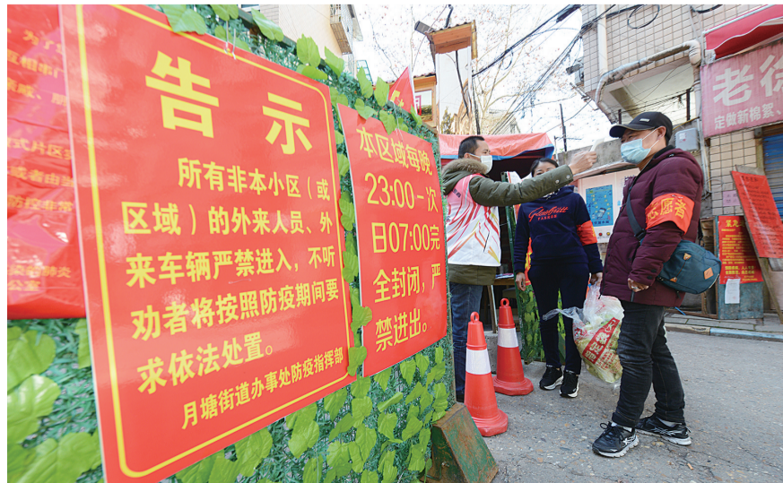
▲在小区的唯一出入口,志愿者为归来的居民测量体温。