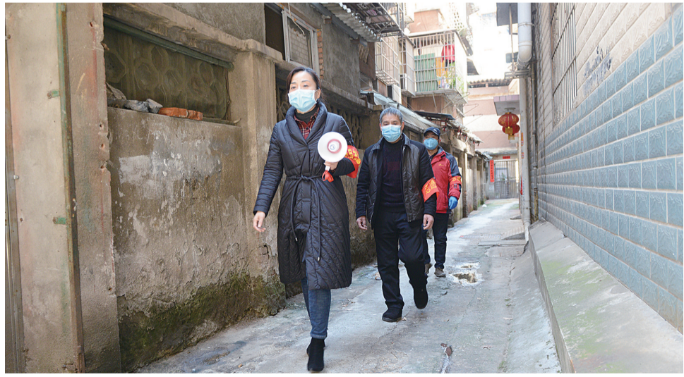
▲社区志愿服务队在城中村义务巡逻,宣传防疫知识,检查外乡返乡人员居家隔离情况,并对扎堆聊天、不规范佩戴口罩的居民进行劝导。