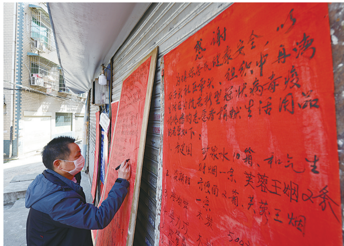
▲热心居民为防疫值守点志愿者送来方便面、口罩、八宝粥等生活物资,防疫值守点进行张贴公布。