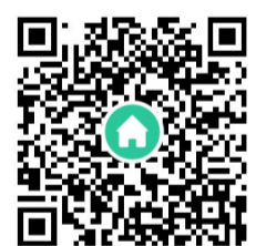
▲扫码可观看《居民志愿者守护小区》短视频 拍摄/剪辑 刘震

被封闭的楼栋外不适合搭建简易棚,值守人员只能在屋檐底下坚守,冷风穿堂、街道清冷,陪伴他们的只有幽暗的路灯,“若有战、召必回,疫情不退,我们不退”,7名退役军人用实际行动践行者铮铮誓言。(记者 李卉)