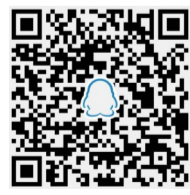
▲晚报乐活周刊QQ读者群