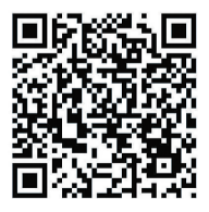
▲晚报乐活周刊微信群