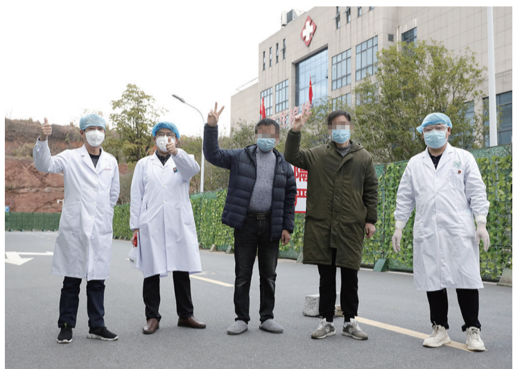
▲昨日出院的2名患者与医护人员合影

本报讯(记者 杨凌凌)2月14日下午,在涪口区人民医院,经过省市专家组会诊,又有2名新冠肺炎确诊患者治愈出院。截至当日16时,我市治愈出院新冠肺炎确诊人数增至23人。