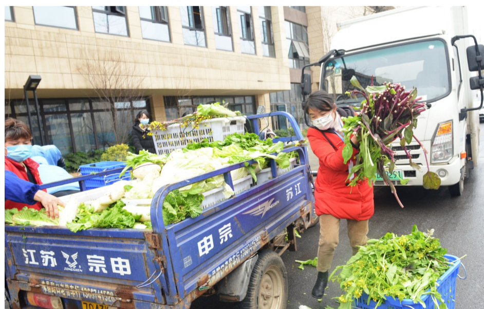
▲栗雨街道中路社区居民把爱心蔬菜送给园区防疫工作人员