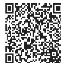
▲扫码看相关新闻视频 制作者 刘珊

市住建局相关负责人介绍,被通报批评企业行为将计入企业信用信息档案。在2月14日前仍未整改到位的,市、区物业主管部门将根据市新冠肺炎疫情防控工作有关规定,报请有关部门依法追究治安处罚、刑事处罚责任。