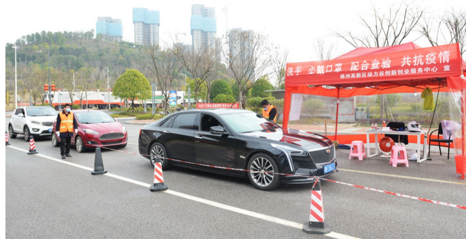
▲员工进入园区,要检测体温和登记信息