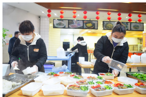
▲园区食堂工作人员正在分装盒饭