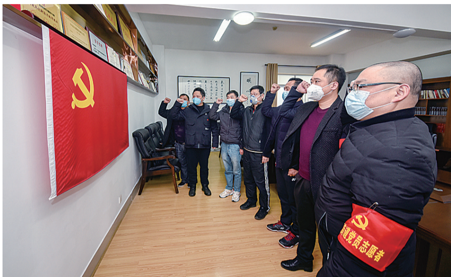
▲株洲日报社疫情防控工作队出征前重温入党誓词

本报讯(记者 戴凇 通讯员 陈向荣)日前,我市正式印发《株洲市“机关干部上前方、合力打赢防疫战”行动方案》(以下简称《方案》)。