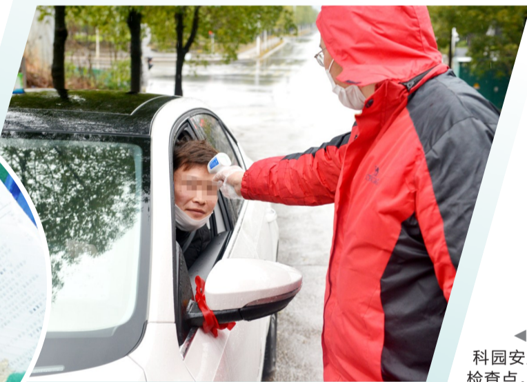
▲田心高科园安置小区检查点,志愿者对进入小区的人员测体温