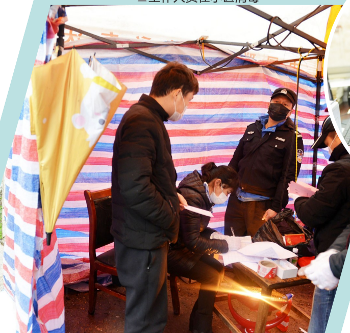
▲田心高科园安置小区检查点,志愿者24小时轮班