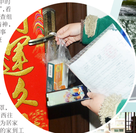
▲网格员帮隔离观察的居民买药并挂在门上