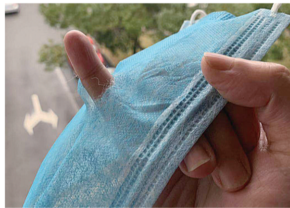
▲手指轻松戳穿了口罩

本报讯(记者 贺天鸿)近日,多位市民拨打晚报新闻热线28829110反映,自己网购的口罩薄如蝉翼,怀疑是假冒伪劣产品。经市市场监督管理局鉴定,这种口罩是假冒伪劣口罩。