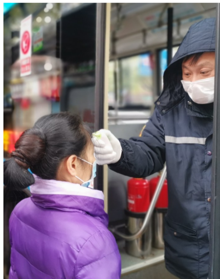
▲工作人员为乘客检测体温

恢复“神农城北”至“九方中学”的T35路公交线路。线路途经珠江路、泰山路、长江南路、中心广场、建设路、人民路、红港路、红旗北路等。