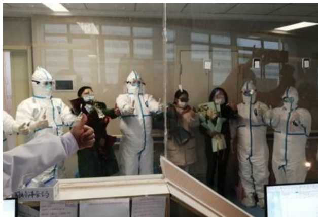
▲株洲援鄂医疗队队员和3名治愈出院患者合影

本报讯(记者 杨凌凌 通讯员 焦海禄)2月7日,在湖北黄冈的大别山区区域医疗中心南一栋西五区,株洲援鄂医疗队负责救治的3名确诊患者治愈出院。这也是株洲援鄂医疗队在当地成功治愈出院的首批患者。据悉,1月29日,株洲医疗队进驻大别山区区域医疗中心,负责该中心的一个普通患者病区。目前,该病区有66个床位,已收治了59位患者。