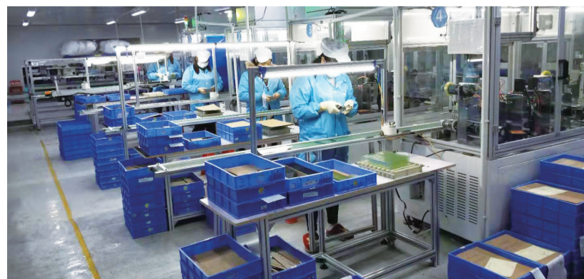
株洲晶彩工厂里,工人们正在紧张生产中。

这几天,朋友圈流传着一个段子:远离微信步数靠前的人,在这种不宜出门时期到处乱窜的人非常危险。确实,在很多人看来,微信运动排名靠前的人被感染的可能性更大,然而,这些人当中有很多放弃休假,冲在一线的“社区人”,摸底排查的是他们,检测体温的是他们,对重点区域消毒的也是他们,正是他们的坚守与付出,为居民筑起了一道安全防线。